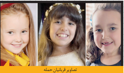
تصاویر قربانیان حمله

مرگبار به کلاس یوگا، یک پسر مهاجر و مسلمان بوده است. تحریک‌ها در فضای مجازی رفته رفته زمینه‌ساز یک شورش بزرگ شد. تاجایی که دهه‌انفر در شهر ساوت‌پورت راهی خیابان‌ها شدند و این شهر در چشمه بر هم زدن به صحنه اعتراضات خشونت‌آمیز و درگیری مردم با پلیس بدل شد که در جریان آن حدود ۴۰ نیروی پلیس زخمی شدند. این شورش‌ها در چند شهر دیگر از جمله مرزیساید هم رقم خورد و باعث مجروح شدن ۸ مأمور پلیس شد که دچار شکستگی پا، پارگی پوست، شکستگی بینی و آسیب مغزی موقت شدند. به‌گفته پلیس، یکی از مأموران امنیتی نیز در صحنه حادثه بی‌هوش شد. به‌گفته پلیس مرزیساید، افراد دخیل در این شورش‌ها حامیان «اتحادیه دفاع از انگلیس»، گروهی راست‌افراطی با تفکرات اسلام‌هراسانه بودند.