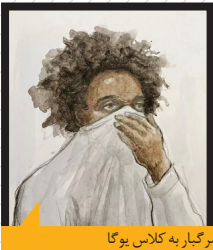
۲ تصویر از عامل حمله مرگبار به کلاس یوگا