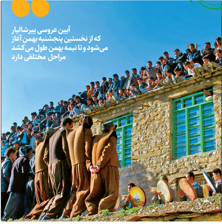
عکس‌ها همشهری اینهم شهریار

رسید گوش‌هایش شنوا شد و زمانی هم که به خانه پیر شالیار رسید، دیوی از غاری بیرون آمد و بر زمین افتاد و مرد. با مردن دیو، زبان شاه بهار خاتون هم باز شد. طبق وعده پادشاه، دختر را به عقد پیرشالیار در آور دند و مردم اورامانات هم جشن عروسی بزرگی برای پیرشالیار و شاه‌بهار خاتون نزدیک روستانای اورامان تخت کردند.